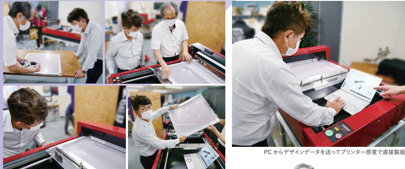
PC からデザインデータを送ってプリンター感覚で直接製版

GOCCOPROシリーズの「RISOドライ感熱スクリーン製版システム」は、乳剤などの薬品や水を使わない製版方式のため、従来の製版プロセスを大きく短縮できる