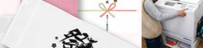
③半自動の印刷機で名入れプリントする。水性インクなので自然乾燥して完成。