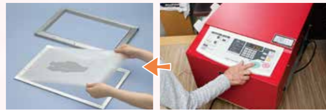
①パソコンから製版データを送信してスタートボタンを押すだけ。わずか1分45秒※4で製版できる。