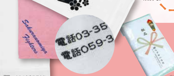
④リソグラフでのし紙を印刷する。