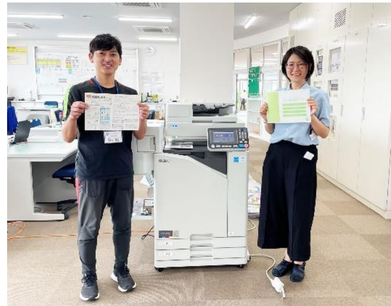
福岡市の小学校でご利用いただいている 高速インクジェットプリンター