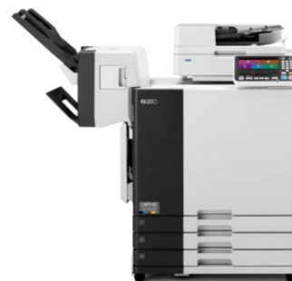
GDシリーズ (世界最速、高生産性を追求) 国内:9月～ 海外:2017年1月～