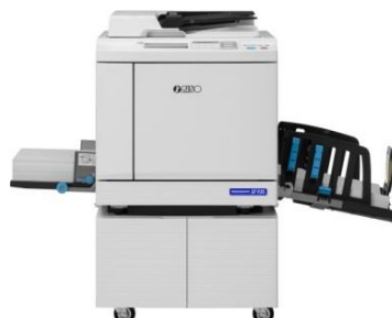
SFシリーズ(普及機) 国内:8月～ 海外:8月～