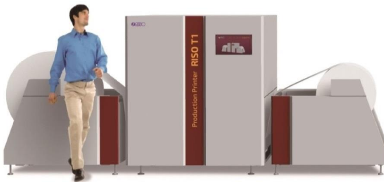
RISO T1 (ロール紙)

参考出展 2016年6月 ドイツ drupa2016 2016年9月 米国 Graph Expo 2016