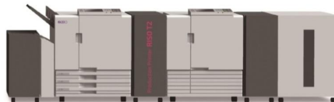
RISO T2 (カット紙)