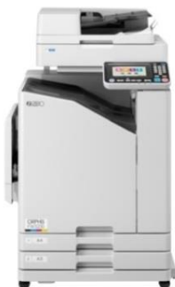
FWシリーズ (コンパクトサイズ) 国内:3月～ 海外:6月～