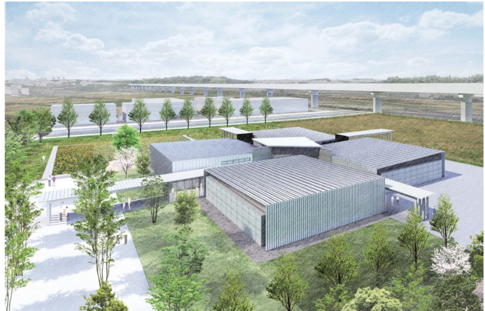
研究開発棟完成イメージ