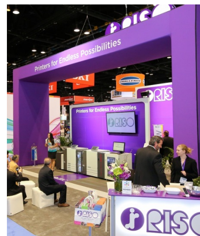
Print 18 (米国)