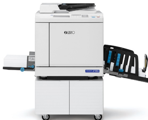
リソグラフ SF935 II