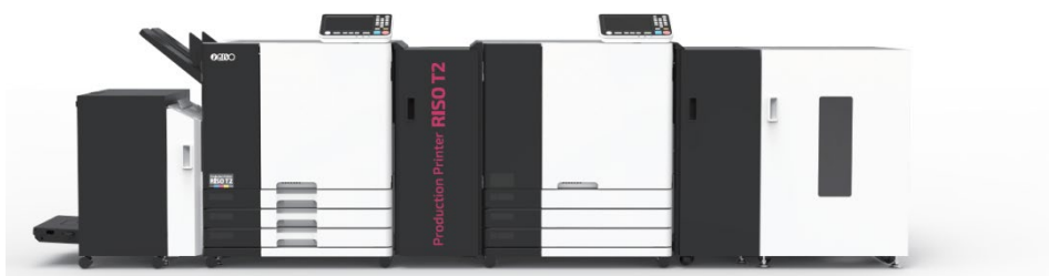
RISO T2 (プロダクションプリンター)