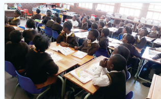
教材準備にかかる時間とコストを低減