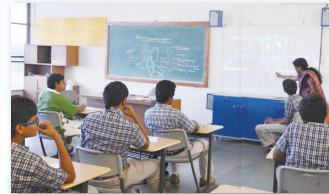
毎週行われる進級試験の膨大な印刷時間 が、「リソグラフ」の導入によって短縮