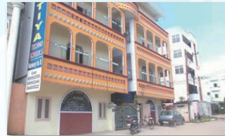
ハイレベルな教育で多数の生徒数を誇る 私立高校