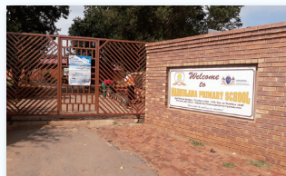
1957年に設立された公立小学校