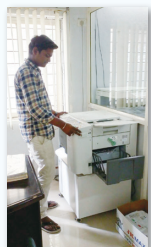
消費電力が少なく、薄紙にも高速印刷できる「リソグラフ」