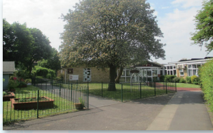
想像力とやる気の育成に定評のある 幼児学校