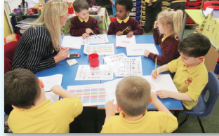
子どもたちの知識習得にフルカラー印刷 が役立っている