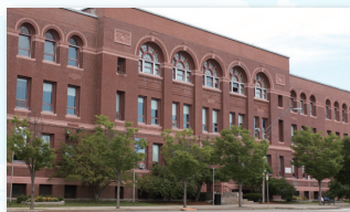
就職に直結した多彩なカリキュラムが揃う4年制の公立高校