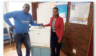
スピードと安定した印刷品質の「リソグラフ」が活躍