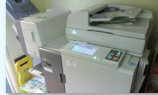
「オルフィス」でコストを抑えたフルカラー 印刷