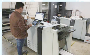
デザインから印刷までを学ぶカリキュラムでは、カラーで製本が可能な「オルフィス」が活躍