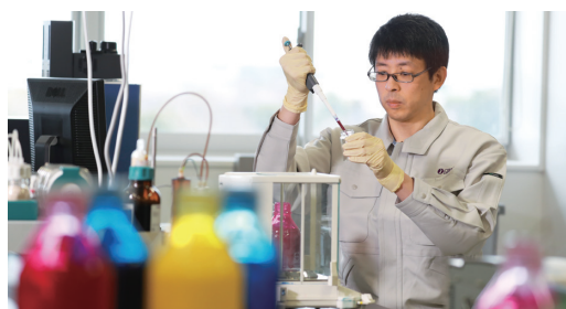
TVOC放散の少ないインクを開発

インクについて全ての原材料の選定から見直し、VOCの放散が少ない原材料を選定し、インク製造方法に新技術を導入することで、インクからのVOCの放散をより少なくすることに成功しました。