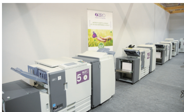
コピーセンターに8台設置された「オルフィス」(現地販売名はComColor)