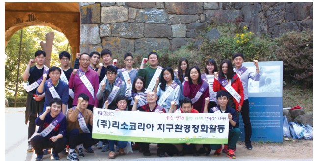
清掃活動の参加者

RISO KOREAでは、たくさんの人々が訪れる観光地や文化財など、日常的な環境整備が欠かせない地域の清掃や環境保全活動を2010年度より毎年実施しています。2015年10月には、ユネスコの世界文化遺産にも登録されている南漢山城周辺の清掃活動を行いました。