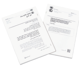
当日印刷された資料(左がアラビア語版、右が英語版)