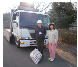
エコキャップ回収