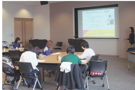
復職支援セミナーの様子