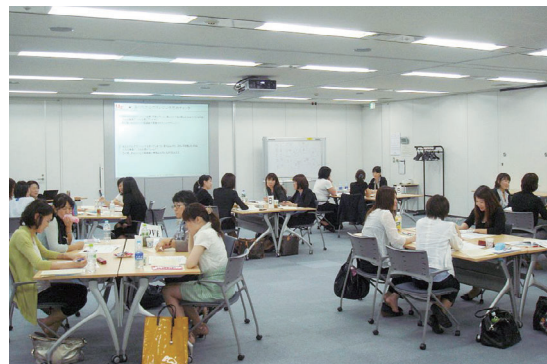
女性キャリア研修の様子

2011年から「女性社員キャリアデザイン研修」を実施し、女性社員の活躍を支援しています。2013年は、「女性キャリア研修」を開催し、24名が「モチベーションの高め方」「リーダーシップスタイルの習得」「環境変化のなかでの自身の未来像の見つけ方」などをテーマとしたプログラムを受講しました。今後も、活動のレベルアップを図っていきます。