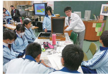
柎形中学校での出張授業

新聞づくりやリソグラフ印刷の実演を通して、印刷の歴史や、環境に配慮した印刷を実体験してもらうことができました。