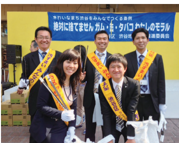
「しずやの日」の地域清掃活動

2013年度は当社製品の回収・再資源化の既存ルートを活用し、関連業者の協力を得て集めたキャップの回収を開始しました。