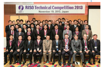
「RISO Technical Competition 2013」

勝ち抜いた精鋭を集めて世界大会（2年に1回）を開催し、グループ全体でのCEのレベルアップを図っています。2013年は11月に世界大会が開催され、技術力を競い合いました。