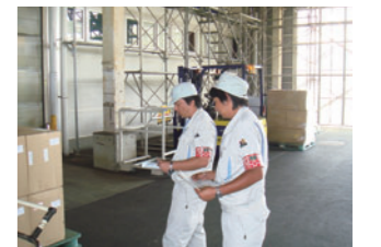
安全衛生点検パトロール

各生産事業所では、「安全衛生委員会」を設け、職場環境整備、不安全箇所の発見と是正、「ヒヤリハットの活動」*2などにより、事故・災害防止に努めています。また、社内イントラネットに「安全衛生」のページを設け、社員の安全意識の啓発・教育を行っています。加えて、化学物質の取り扱い・保管・管理に携わる社員へは手順書を作成し教育を実施して