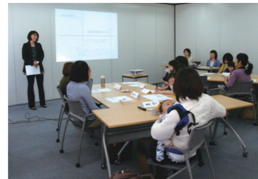
復職支援セミナーの様子