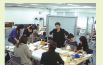
女性キャリアデザイン研修

2010年10月に移行した新人事制度では、全ての社員がキャリアを自律的に考え、活躍できるしくみとなりました。2012年8月に実施した「女性キャリアデザイン研修」は、全ての社員が活躍できる風土醸成のスタートとして、ライフイベントに直面し時間や働き方に影響を受けやすい「女性」の意識変化に焦点を当てた施策の一つです。仕事での活躍の可能性を意識し将来に向けたキャリアデザインを描くことで、生産性向上を主体的に考えていくことを目的としています。