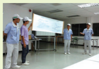
QCサークル活動発表会