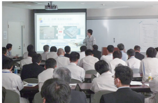
改善提案活動成果発表会

日々の業務を通じたスキルアップ (On the Job Training) を基盤に、階層別研修、部門別の専門教育、年代別のキャリアプラン・ライフプラン研修などを実施しています。また、自らの能力・スキルアップに意欲的な社員を支援する制度として、会社が指定する資格・検定を取得した場合に祝金が支給される「資格取得・検定受験支援 (祝金制度)」を設けています。このほか、従業員の意欲向上と創意工夫を推奨する「改善提案制度」、「特別報奨制度」も設けており、毎年、活動成果発表会を開催するとともに、優れたアイデアやチャレンジを表彰しています。