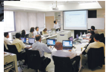
バンコク トレーニングセンター