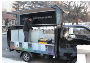
韓国で活動中の デモカー

理想科学では、日本国内において担当者の所在状況を「RISOコンタクトセンター」で一元管理し、最短時間で訪問できるしくみを整えています。お客様の元への移動に伴う環境負荷にも配慮し、エコカーや電動自転車を導入しています。また海外でも、各地にトレーニングセンターを展開し担当者の知識・スキル向上に取り組むとともに、一人でも多くの方にRISO製品を体験してもらうために実機を搭載したデモカーを製作するなど、効率的な営業・サービス活動を行っています。