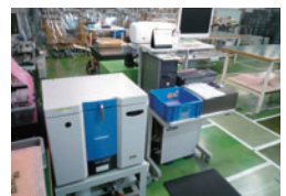
含有化学物質検査機 (筑波工場)

製品を構成する多数の部品・ユニットのそれぞれについて、環境への配慮を行っています。細かな構成部品の一つひとつを厳しく吟味し、有害な物質やリサイクル性が低い材料については、製品への使用を制限しています。また、筑波・霞ヶ浦・宇部の国内3生産事業所では、エネルギー効率の高い設備の導入、照明や空調管理の徹底などを通じて、エネルギーと資源のムダ使いの削減に努めています。