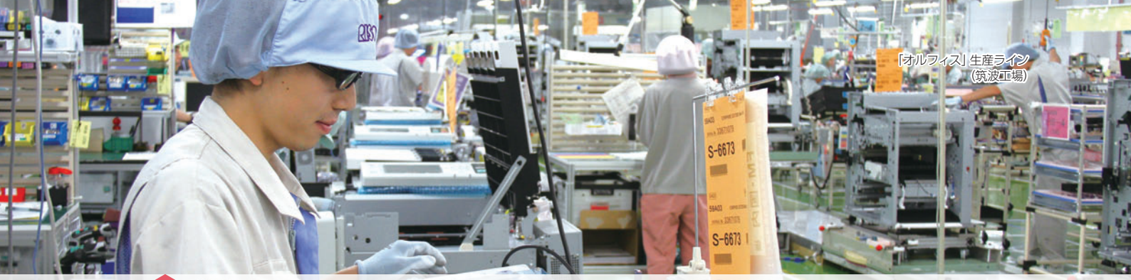
【オルフィス】生産ライン (筑波工場)