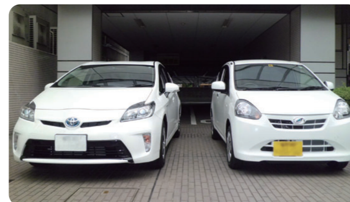
営業車にエコカー導入

また、営業・サービス活動の移動営業車の使用に伴う環境負荷にも配慮し、エコカーや電動自転車を導入しています。