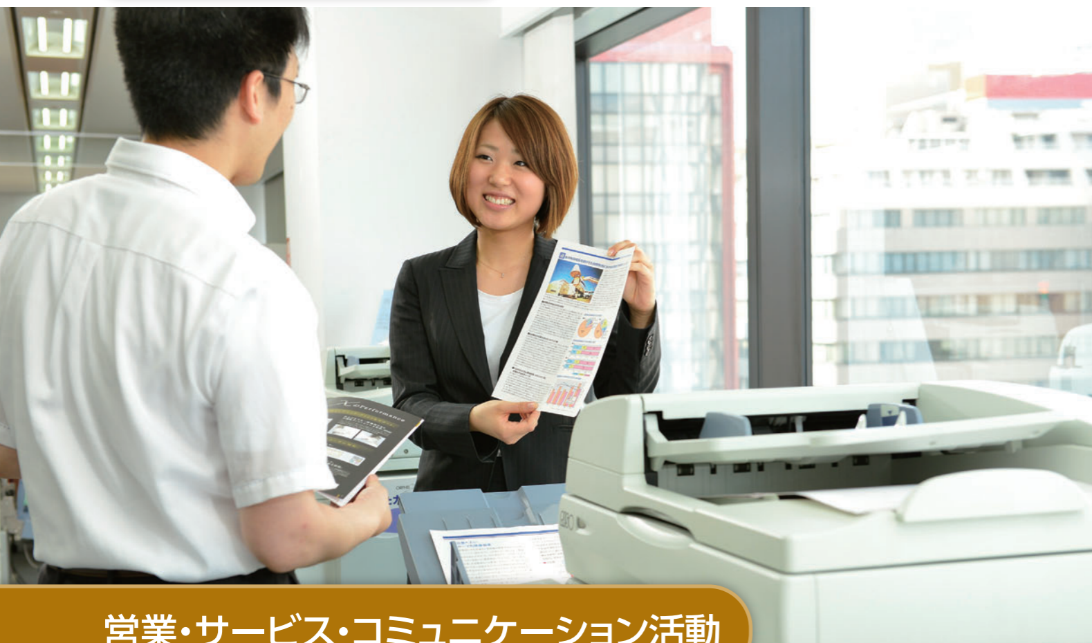
本社ショールーム