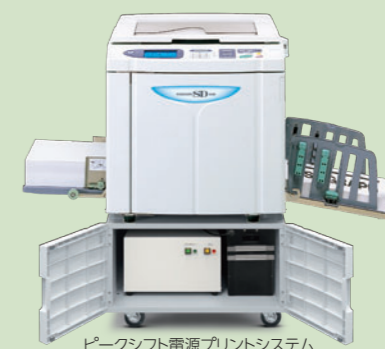
ピークシフト電源プリントシステム

また、お客様の省エネへの関心が高まっていることから、作業環境の省エネにつながるLED照明を取り扱っています。