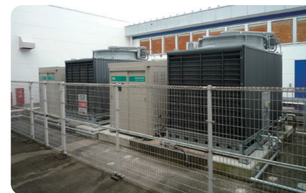
省エネ型熱交換器の導入

また、筑波・霞ヶ浦・宇部の国内3生産事業所では、エネルギー効率の高い設備の導入や照明や空調管理の徹底などを通じて、エネルギーと資源のムダ使いの撲滅に努めています。