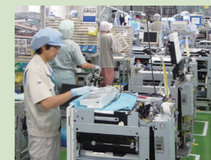
筑波工場「オルフィス」生産ライン

今後も、品質第一をモットーに、安心してお使いいただける製品の安定供給に努めていきます。