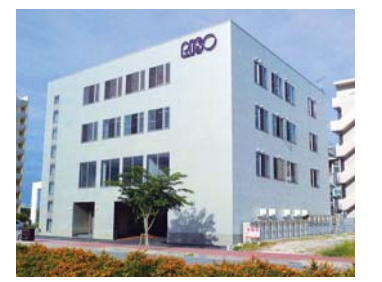
RISOコンタクトセンター