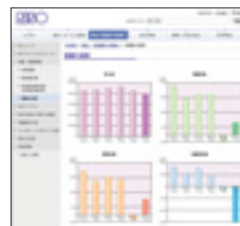
株主・投資家の皆様へ「業績の推移」

当社は、適時・適切、かつ積極的な情報開示は企業の重要な責務であるという認識のもと、決算短信や決算説明会資料、個人投資家の皆様向けの事業報告書などの財務情報や株式情報を、Webサイト上で開示しています。また、毎年中間決算、本決算発表後にアナリスト・機関投資家の皆様向けの説明会を実施しています。