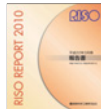
株主様向け「報告書」

株主・投資家の皆様へ http://www.riso.co.jp/home/kabu/