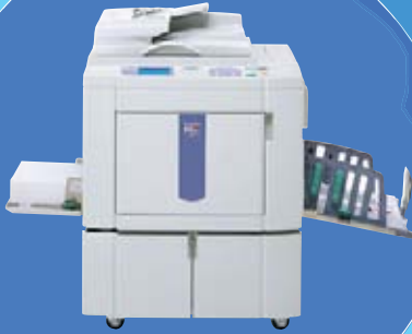
デジタル印刷機 リングラフ

孔版印刷方式のデジタル印刷機「リングラフ」シリーズ。同一原稿多枚数の印刷が得意です。ドラム交換で印刷色替えも可能です。